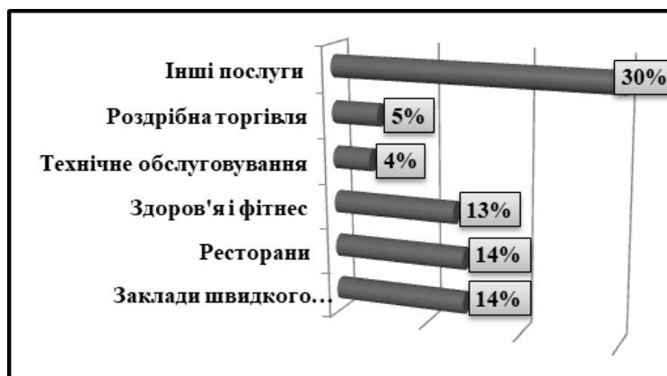
Рис. 3. Галузевий розподіл ринку франчайзингових послуг у США в 2020 році, (%)

Модель франчайзингу поширена практично у всіх галузях економіки США, проте велику частку займає громадське харчування, бізнес і побутові послуги. Лідерами американського ринку є сегмент швидкого громадського харчування та ресторани, на частку яких припадає по 14 %, далі йдуть послуги здоров'я та фітнес з часткою в 13 % 4 , (рис. 3):