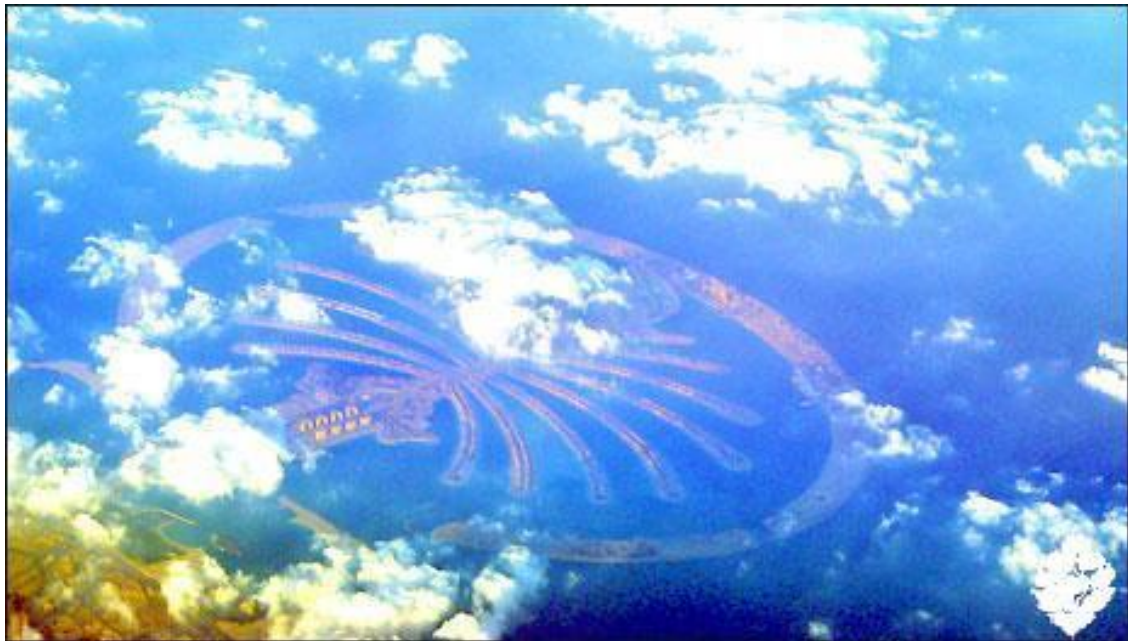
Рис.5. Острів Пальма 1 (Джумейра), м. Дубай, ОАЕ

Цілком очевидною є відсутність кореляцій із будовою Всесвіту, нівелювання сакрального боку (метафори не можуть замінити міфи), відсутність циклічних ритуалів, локальність захисту, порушення фрактальної організації. Таким чином, незважаючи на незрівняно вищі технічні можливості, ці міста слабо гармонюють як з навколишнім світом, так і внутрішнім світом людини і не сприймаються як комфортні. Отже, сучасним архітекторам є чому повчитись у стародавніх, творчо переосмислюючи їх підходи у відповідності із сучасним рівнем науки, культури і суспільної організації.