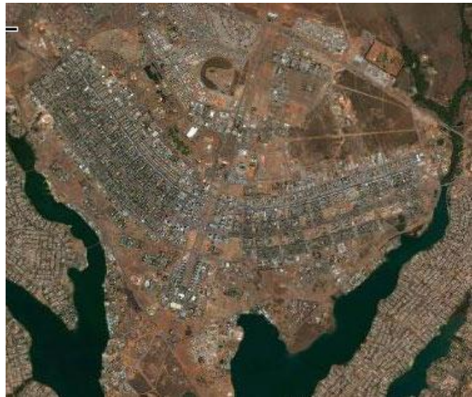
Рис. 4. Місто Бразілія, Бразілія. Архітектори О. Німейер та Л. Коста