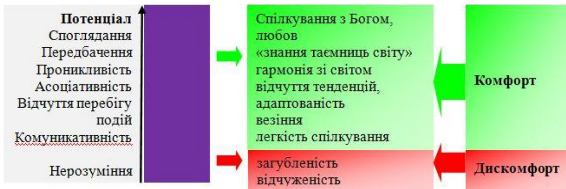
Рис.2. Визначення зон комфорту і дискомфорту для рівню 1

бов'язково точно задавати. Більшу чи меншу їх «інтуїтивність» природно пов'язати із рівнем потенціалу. Результат показано на рис. 2.