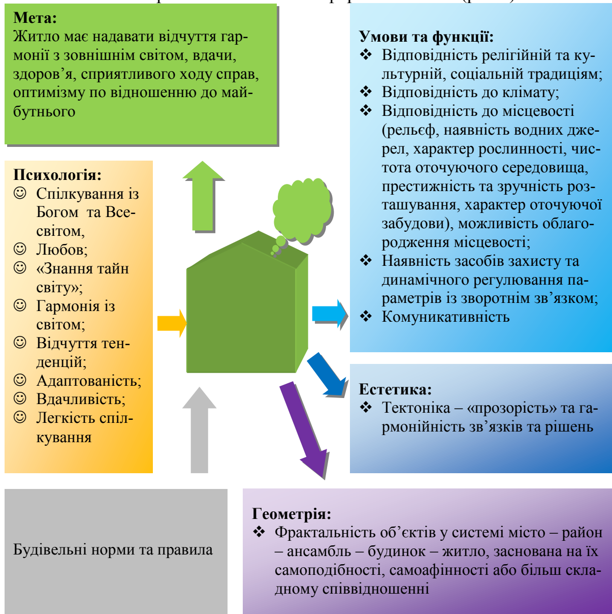
Рис. 2. Інтерпретація умов комфорту у категоріях функціональності, естетики та геометрії

Спираючись на ці дані, визначимо мету, умови та функції, вимоги до естетики та геометрії психологічно комфортного житла (рис.3).