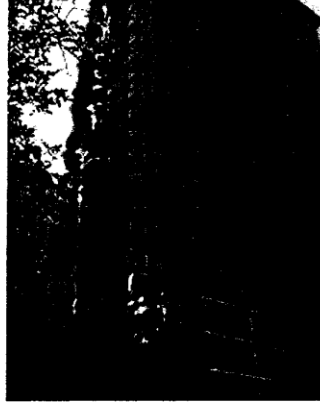
Рис.2. Пожежа у висотному будинку по вул. Гетьмана, 16 у метро Шулявська охопила 18 поверхів - з 4-го по 21-й

При високій температурі при пожежі зменшується міцність перекриттів і вони можуть обвалитися. Обвал може трапитися і після пожежі, оскільки після зниження температури міцність перекриттів вже не відновлюється. Перекриття обвалюються також через скупчення на них води, якою заливався вогонь.