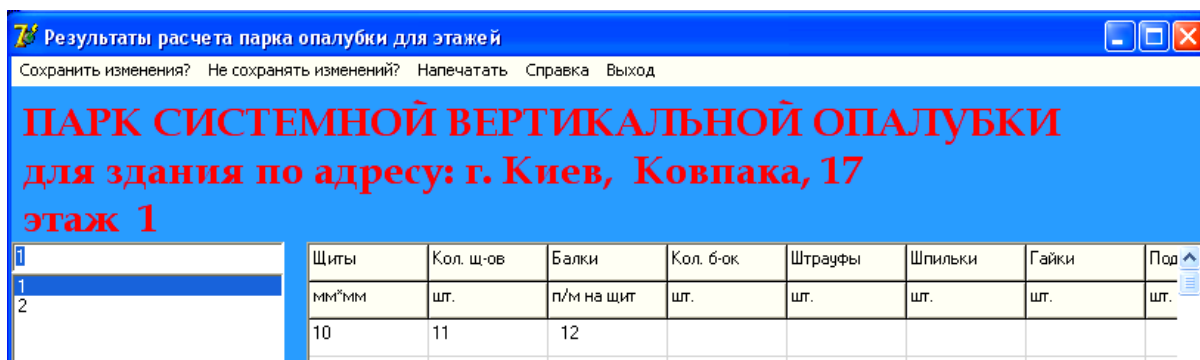
Рис. 3. Відображення результатів розрахунку парку опалубки

При перегляді проектних рішень (рис.3) виводяться дані щодо адреси будинку, поверху, захватки, окремого елемента у вигляді типової таблиці. Зміст пунктів головного меню форм зрозумілий з їх назв. Крім того, є дві кнопки редагування таблиць, не показані на рисунку.