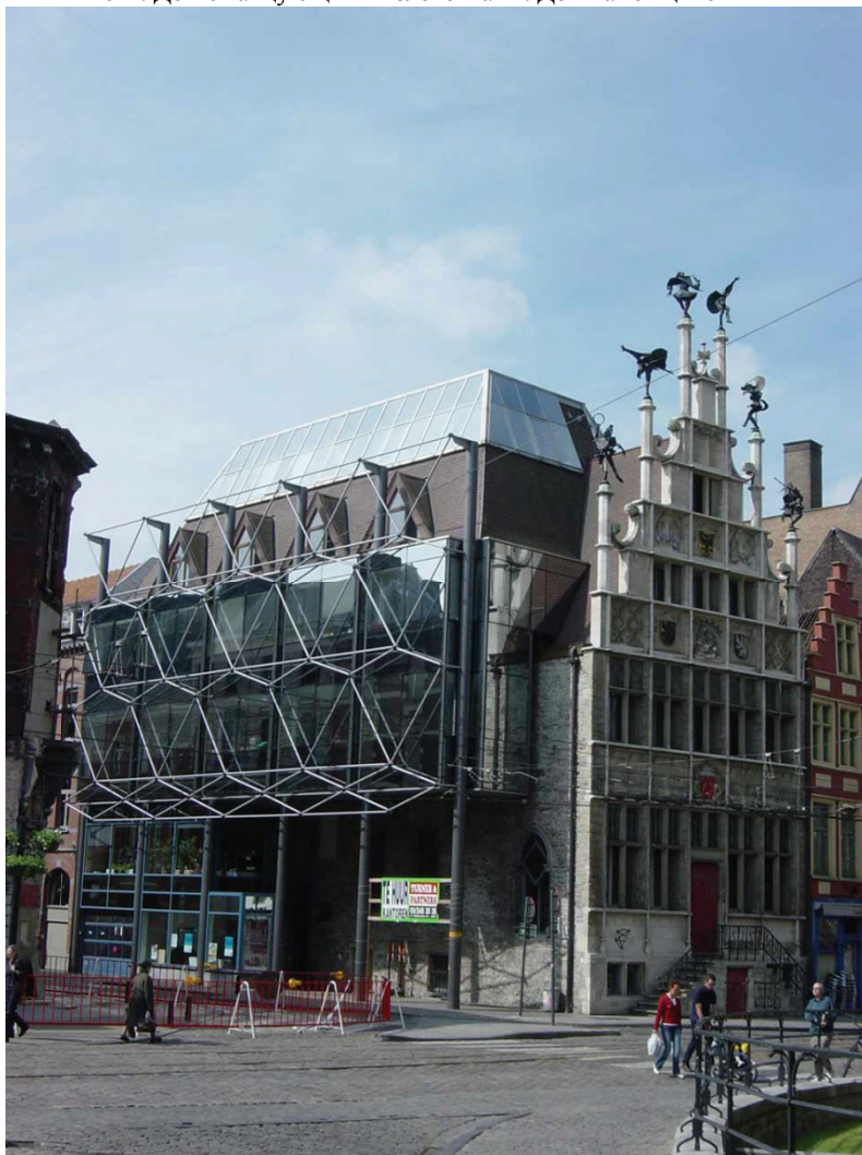
Гент. Дом с танцующими человечками. Дом каменщиков

В данном примере архитектор произвел современную реконструкцию, сохранив при этом самую красивую и значительную историческую часть фасада здания и функциональную его «начинку»: высокий цоколь - это погреб 13 века, дренажная система 13 века действует великолепно, двери окрашены в красный цвет - это традиция с 16 века.