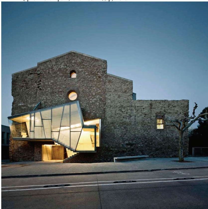
Церковь Св. Франциска в Санпедор, Испания

Задачей архитектора было не только восстановить церковь, но и интегрировать в нее многофункциональный культурный центр, не ломая при этом исторической целостности сооружения. Архитектор не пытался создать абсолютно новый объект, он просто адаптировал то, что есть, к новым требованиям и произвел модернизацию.