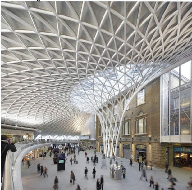
Вокзал King's Cross

Реконструкция этого вокзала включает перестройку железнодорожного депо и окружающих вспомогательных зданий, реставрацию исторических зданий и главного викторианского фасада, строительство нового помещения.