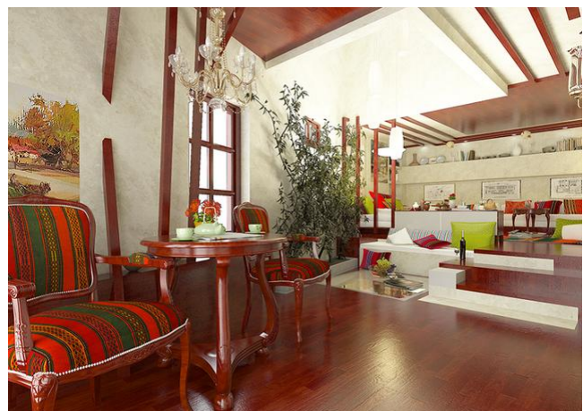
Рис.1. Готельно-ресторанний комплекс в Болгарії, студія Gemelli Design

Етнодизайн в сучасній інтерпретації – це яскрава суміш традицій і сучасних мотивів, які разом творять простір. Одним з яскравих прикладів подібного проекту є готель в Пловдиві – древньому місті в Болгарії.