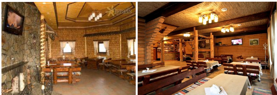
Рис 7. Готель-ресторан "Старий Плай" м. Закарпатська область

Матеріали для облаштування інтер'єрів в етностилі різноманітні, як і національні особливості тієї або іншої країни. Для оздоблення, зазвичай, використовуються або природні матеріали, або їх імітація. Причому імітація має бути фактурною, інколи навіть нарочито грубою, нагадує "необроблену" поверхню.