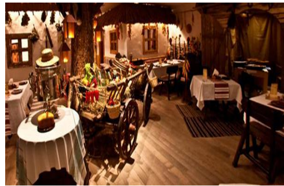
Рис. 5. Ресторан "Корчма" м. Запоріжжя