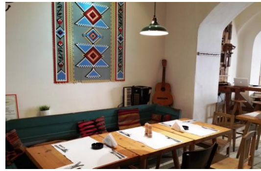
Рис.4. Ресторан Lacrimi si Sfinti . Бухарест

Проект інтер'єру ресторану Lacrimi si Sfinti в Бухаресті (рис.4), автором якого є дизайнер Cristian Corvin , отримав спеціальну премію 2012 Bucharest Annual . Самобутня атмосфера цього місця сформована завдяки майстерному поєднанню в інтер'єрі вантажних і сучасних деталей.