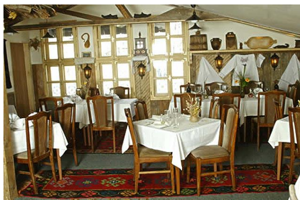
Рис.3. Ресторан "Златар" м.Белград

Ресторан “Златар” спроектовано у 1985 році з використанням сербських традицій. На рис. 3. представлено два обідні зали, що обслуговують 110 осіб. Колірна гама є спокійною, а світло не є яскравим, локальне, освітлено окремі частини приміщення.