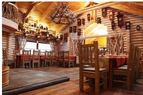
Рис. 6. Ресторан "Є-моє" м. Донецьк