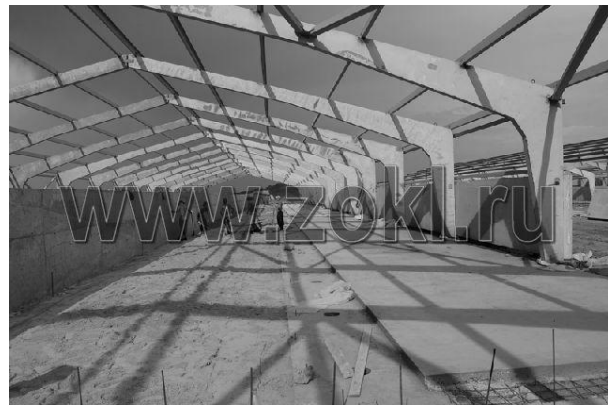
Рис. 1. Внутрішній вигляд каркасної будівлі

2) більш низька вартість у зв'язку з відсутністю зайвих витрат на будівельні матеріали (рис. 1).