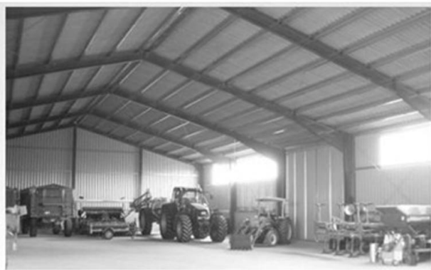
Рис. 3. Металеві каркаси модульних будівель

Сучасний розвиток бізнесу зумовив зміну в технології будівництва і, як наслідок, заміну багатьох будівельних матеріалів відповідно до нових рішень. Цеглу і бетон замінили легкі металокаркаси, застосування яких стало можливим завдяки новим інженерним рішенням. Результатом таких змін стало повсюдне впровадження технологій зведення споруд, в основу яких покладено модульні металокаркаси (рис. 3). Сьогодні ці технології є пріоритетними.