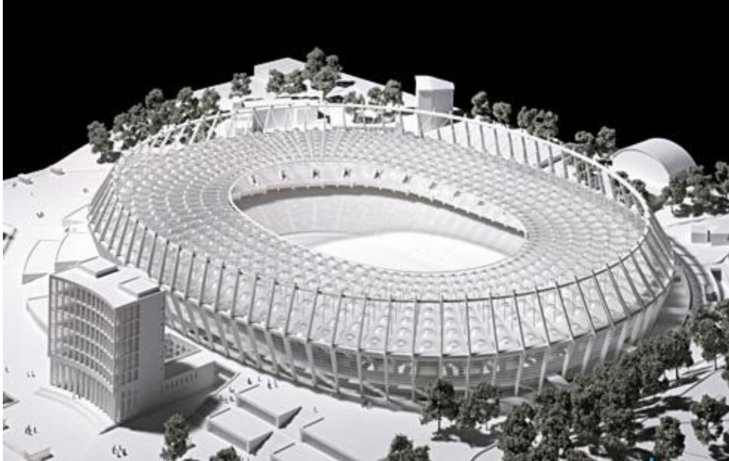
Рис. 4. Макет для реконструкції НСК «Олімпійський»

Висновки. Національний спортивний комплекс «Олімпійський» та його реконструкція є дійсно величезним проектом, над яким працювали сотні спеціалістів, включаючи розробку його макету, дизайну (рис.4), та тисячі будівельників, які вклали свої сили для возведення цієї конструкції.