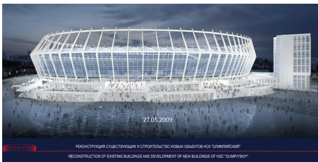
Рис.2. Дизайн стадіону НСК «Олімпійський»

Основна частина. Проектування та дизайн стадіону. З північно-західної сторони конструкція має дворівневі приміщення, що розташувалися нижче за вхід на перший ярус стадіону(рис.2). Між колонами можна відмітити сходи, які ведуть на другий ярус. Фасад стадіону покритий прозорою оболонкою. У верхній частині розташовані мембранно-тканинний дах і троси, що підтримують її. 13-поверхова будівля Олімпік Стар з'єднана зі стадіоном підземним поверхом та наземним, так званим Італійським двориком, що існував там раніше. [4]