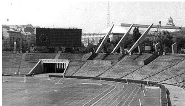
Рис. 1. Монтаж опор та ригелів другого ярусу трибуни 1967 рік.

У 1966 році стадіон було реконструйовано: на 80 залізобетонних опорах спорудили другий ярус трибун (рис.1), після чого кількість місць збільшилася до 100 тис. глядачів. Ще одна реконструкція підготувала стадіон до проведення матчів групового футбольного турніру XXII Олімпійських ігор 1980 р.