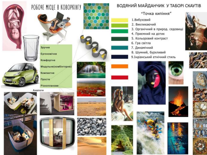
Рис. 4. Приклад студентської розробки релевантної дошки настрою з дисципліни «Проектування», кафедра дизайну інтер'єру, НАУ

розробника, так і для замовника (рис.4). Світлини або символічні речі, що створюють відповідний настрій, впливають на вибір масштабу елементів, кольорової гами, тактильної характеристики матеріалів оздоблення, потужності та загальної композиції освітлення. В якості зображень доречно використання продуктів відомих брендів, що виявляє вимоги до якості, цінової категорії, екстравагантності або інших ознак об'єкту.