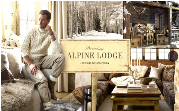
Рис. 6. Фрагмент презентаційного буклету інтер'єрної колекції «Альпійський будиночок» Ральфа Лоурена

В дизайні інтер'єру цю роль виконує комплект презентаційних планшетів ескізного проекту або колекції виробів – меблів, світильників тощо, який супроводжує комплект професійних креслень (рис.6).