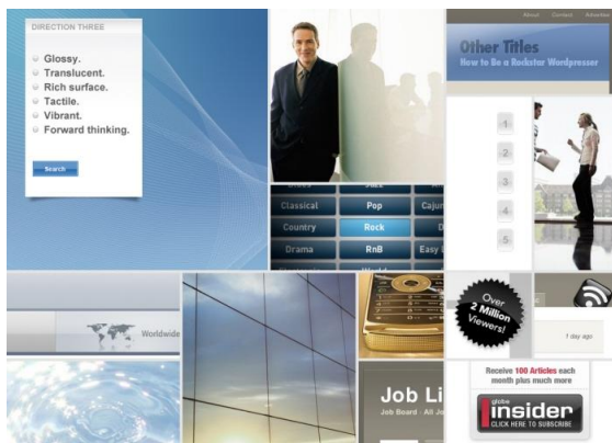
Рис. 3. Приклад релевантної дошки настрою у Web-дизайні

1. Релевантна дошка настрою (Relevant mood board) - створюється до початку розробки на першому етапі спілкування замовника і розробника-дизайнера. Попереджає проектування і призначена для узгодження уявлень замовника та розробника про задачі та якості майбутнього продукту. Колаж складається з тез-вимог замовника до проекту («дерево бажань») і зображень, запропонованих дизайнером та погоджених клієнтом, кожне з яких ілюструє конкретну якість проекту (рис.3).