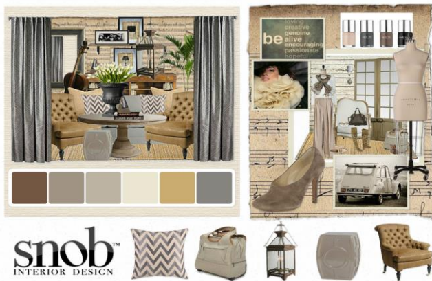
Рис. 2. Приклад дошки настрою, яка створена з використанням комп'ютерних технологій.

Визначено, що певним етапам розробки проекту відповідають особливі види дошки настрою і використовуються відповідні інструменти та техніки розробки.