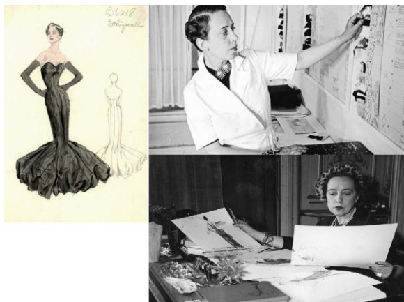
Рис. 5. Моделювання одягу. Ельза Скіапареллі в процесі розробки дошки настрою для моделей суконь.

В дизайні інтер'єру цей тип використовується для розробки акцентних елементів функціонально-планувальної структури або художньої композиції і попереднього (до розробки загальної концепції) обговорення з замовником.