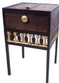
Рис.1. Скринька для коштовностей. Стародавній Єгипет, XI ст. до н.е.

Аналізуючи архітектуру та декоративно-прикладне мистецтво Стародавнього Єгипту, стає зрозумілим, що в ті часи не було такої явної переваги декору над функцією предметів, адже тоді увага зосереджувалася виключно на функції речей. Оздоблення з'являлося лише у тому випадку, коли перша основна роль предмету – функція була дотримана. В основі усього була геометрія, прямі лінії, чіткі форми.