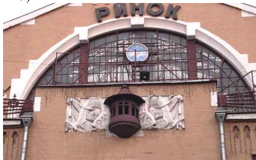
Рис.3. Бессарабський ринок у Києві. 1912 р.

Життя вимагає змін у типології споруд і у самому процесі проектування. Прототипний метод (проектування за зразком) змінюється проектуванням з урахуванням нових функціональних процесів, які відбуватимуться у відповідному просторі, створеному новими архітектурними формами, оздобленими декором з нових матеріалів (рис. 3).