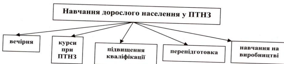
Рис. 2. Навчання дорослого населення (за формою навчання)