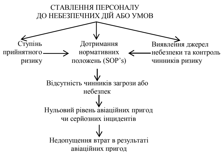
Рис. 2. Подання взаємодії складових концепцій безпеки ІКАО через призму стиковки / нестиковки блоків «суб'єкт - процедури» моделі SHELL

членів льотного екіпажу) до небезпечних дій або умов професійної діяльності, а також до виконання стандартних експлуатаційних процедур (Standart Operational Procedures, - SOP's). Адже дійсно, якщо звернутися до моделі SHELL, запропонованої ІКАО для дослідження проблем ЛЧ [6-8], то складові поточної парадигми ІКАО в області БП, сформульовані усі [5], чітко уявляються через призму стиковки / нестиковки блоків «суб'єкт - процедури» моделі SHELL (рис. 2) [9]. При цьому слід обов'язково мати на увазі, що професійна діяльність АО «переднього краю» зазвичай розглядається як безперервний ланцюг рішень, що виробляються і реалізуються в явних і неявних формах та під впливом різноманітних чинників специфічної природи і характеру [8, 10-13].