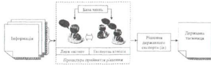
Рис. 1. Модель проведення процедури прийняття рішення державних експертів з питань таємниць у сфері оборони

автоматизованого робочого місця державного експерта (АРМ ДЕ) – програмно-технічного комплексу призначеного для автоматизації державної діяльності у сфері оборони (рис. 2).