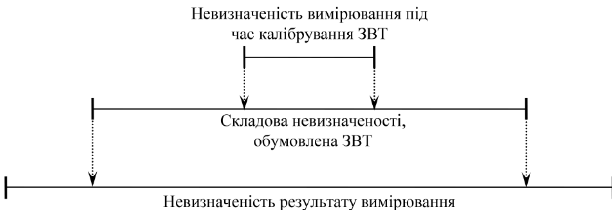
Рис. 4. Внесок складових у невизначеність результату вимірювання

Чи можливе проведення калібрування ЗВТ із використанням еталона (зразкового ЗВТ* [5, п. 8.10]), якщо їхні невизначеності рівні? Якщо як ЗВТ, що калібрується, маємо теж еталон, то така процедура можлива, але це буде не калібрування, а звірення еталонів. У всіх інших випадках таке калібрування практично можливе, але не матиме жодної метрологічної цінності та практичної доцільності. За такого співвідношення невизначеностей еталона та ЗВТ порушується принцип передавання одиниці фізичної величини з нехтовною похибкою (рис. 4). Перехід від стандартизованих, метрологічно обґрунтованих методик із перевірки