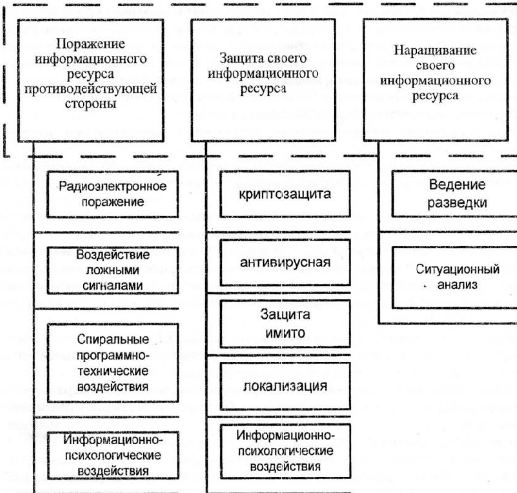
Рис.2. Виды информационных воздействий

При пассивном информационном воздействии изменения состава признаков и поражения связей в системе образов не происходит.