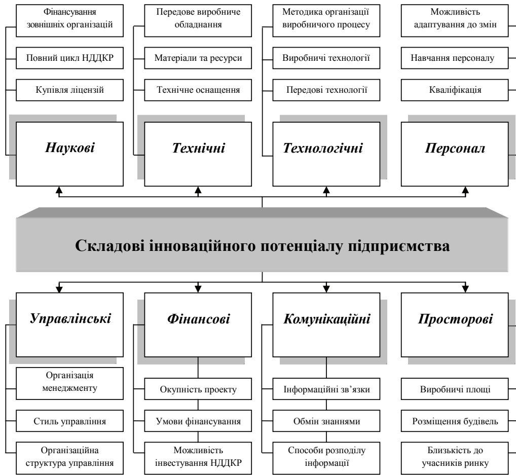
Рис. 1. Складові внутрішнього інноваційного потенціалу для забезпечення конкурентоспроможності підприємства [складено авторами на основі [3, с. 140-148]]