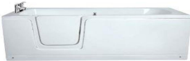
Рис. 1. Ванна для інвалідів з дверцятами

У [4], за кордоном, запропоновано ванну для інвалідів із дверцятами (рис.1), та ванна для інвалідів сидяча (рис.2, а), звичайна ванна «Rosa PRINCESSA 170» (рис.2, б).