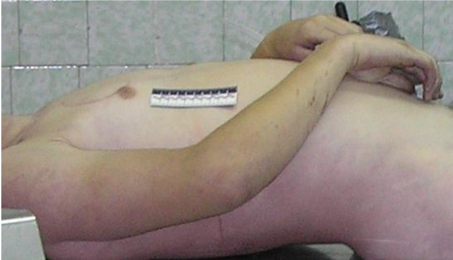
ТРУПНЕ ЗАКЛЯКАННЯ У М'ЯЗАХ ВЕРХНІХ КІНЦІВОК (4-6 ГОДИН ПІСЛЯ НАСТАННЯ СМЕРТІ) (Випадок з експертної практики к.мед.н. Ергард Н.М.)