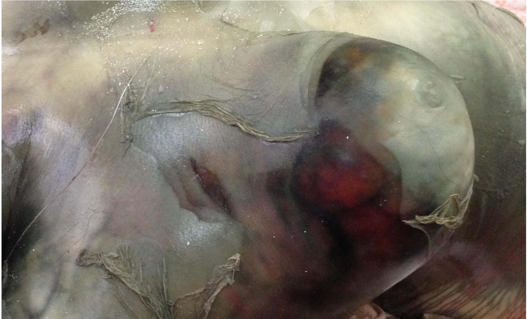
ПОВНЕ ГНИТТЯ ТІЛА (8-12 ДОБА ПІСЛЯ НАСТАННЯ СМЕРТІ) (Випадок з експертної практики д.мед.н. Михайличенка Б.В.)