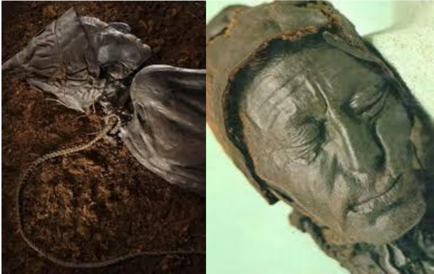
ТОРФ'ЯНЕ ДУБЛЕННЯ (ШКІРА ЩІЛЬНА, МАСЕ ТЕМНО-БУРЕ ЗАБАРВЛЕННЯ)