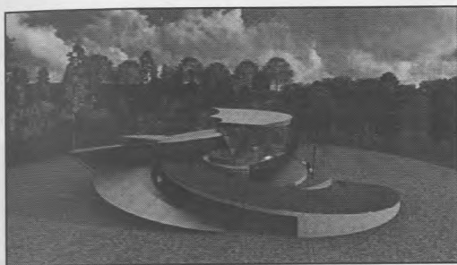
Рисунок 3. Кафе «Андромеда», організація в'їзду на другий рівень

Для вирішення питань організованого громадського харчування пропонується побудувати двоповерхове дитяче кафе на 68 місць на ділянці площею 0,049 га. Форма будівлі в плані (рисунок 3) повторює відомий обрис сузір'я північної півкулі зоряного неба – сузір'я, що містить одну з найвідоміших галактик – Туманність Андромеди, найближчу до землян спіральну галактику, яку помітно навіть неозброєним оком.