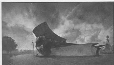
Рисунок 4. Кафе «Андромеда», загальний вигляд

Для відвідувачів кафе доступні обідня зала, безалкогольний бар, ігрова кімната та кімната відпочинку, гардероб, санвузли та ін. Для входу представників маломобільних груп населення передбачені два спіральні пандуси окремо для першого та другого поверхів; спеціально відведені місця у залі та окремий санвузол. Екстер'єр будівлі та інтер'єри приміщень вирішуються у стриманих кольорах (сірий, білий, темно-синій та їх відтінки), які забезпечують стильність рішення та посилюють його зв'язок з Космосом (рисунок 4).