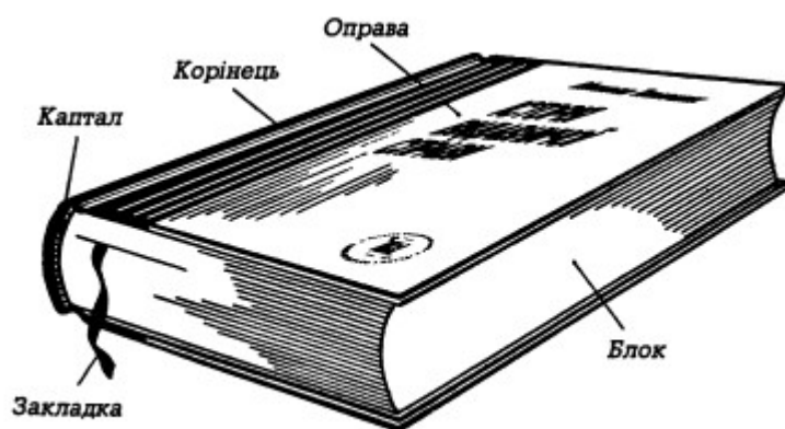
Основні елементи книги

Перегляд відеофільму „Технологічний процес створення книги” (Bookbinding - A Traditional Technique) 40 хв.