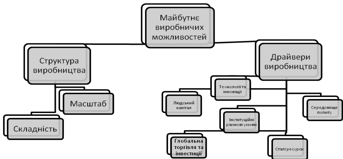
Рис. 3.2. Групи індексів для оцінки рейтингу щодо готовності до майбутнього виробництва

У доповіді представлені результати першого видання «Оцінки готовності до майбутнього виробництва», в якій вимірюється, наскільки добре країни можуть формувати і отримувати вигоду з мінливого характеру виробництва за допомогою прийняття нових технологій. Оцінка складається з двох груп індексів – Структура виробництва, яка представляє поточний стан виробничих можливостей, і Драйвери виробництва, які представляють майбутній стан виробництва, – вимірює стан країни для вкладання коштів у нові технології з метою удосконалення виробничої бази. Ці дві групи індексів включають в себе ряд факторів, які були оцінені для 100 країн (рис.3.2.):