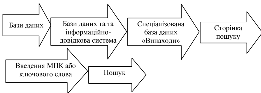
Рис. 3. Алгоритм пошуку

Використовуючи певну рубрику МПК, у пошуковій системі патентного фонду Українського інституту промислової власності знаходять наявні в цій рубриці патенти на винаходи, які найбільше відповідають обраному об'єкту і його рубриці МПК. Для пошуку патентів на винаходи та їх описів можна використовувати такий алгоритм: зайти на сайт Українського інституту промислової власності (режим доступу – http://www.uipv.org/ ) і далі провести пошук за схемою переходів на наступні сторінки (рис. 3).