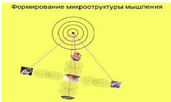
Рис 2. Хвильова природа мислеобраза

прагнення до ідеалів через мрію створить людину, здатну творити своє життя і водночас своє психічне і фізичне здоров'я в тому ступені, в якій його свідомість відповідає рівню поставленої мети еволюції, і навпаки, світ, що оточує людину, в такому ступені формує його рівень пізнання і творчість, наскільки повинно світ відображатися у свідомості людині. (рис.2)