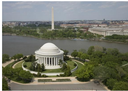
Рис. 3-б. Меморіал Лінкольна