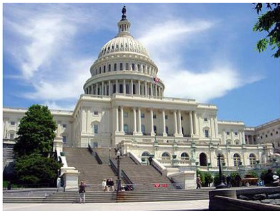
Рис. 3-а. Капітолій

представлені басейнами. Світловідбиваючий басейн Меморіалу Лінкольна (рис. 3-в) є найбільшим з багатьох світловідбиваючих басейнів в Вашингтоні. Басейн був розроблений Генрі Беконом, і побудований в 1922 -1923 роках. Це довгий і великий прямокутний басейн, що розташований на головній осі Національної алеї між Меморіалом Лінкольна та Монументом Вашингтона. Залежно від точки зору глядача, він відображає Монумент Вашингтона, Меморіал Лінкольна,