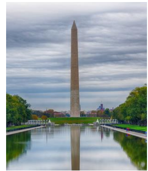
Рис. 3-в. Монумент Вашингтона