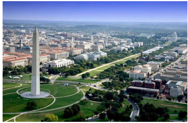
Рис. 5. Національна алея. Вид від монумента Вашингтона.

Після будівництва дванадцятиповерхового житлового будинку «The Cairo» 1894 року, Конгрес прийняв закон про висоту будівель, який обмежив висотну забудову в місті.