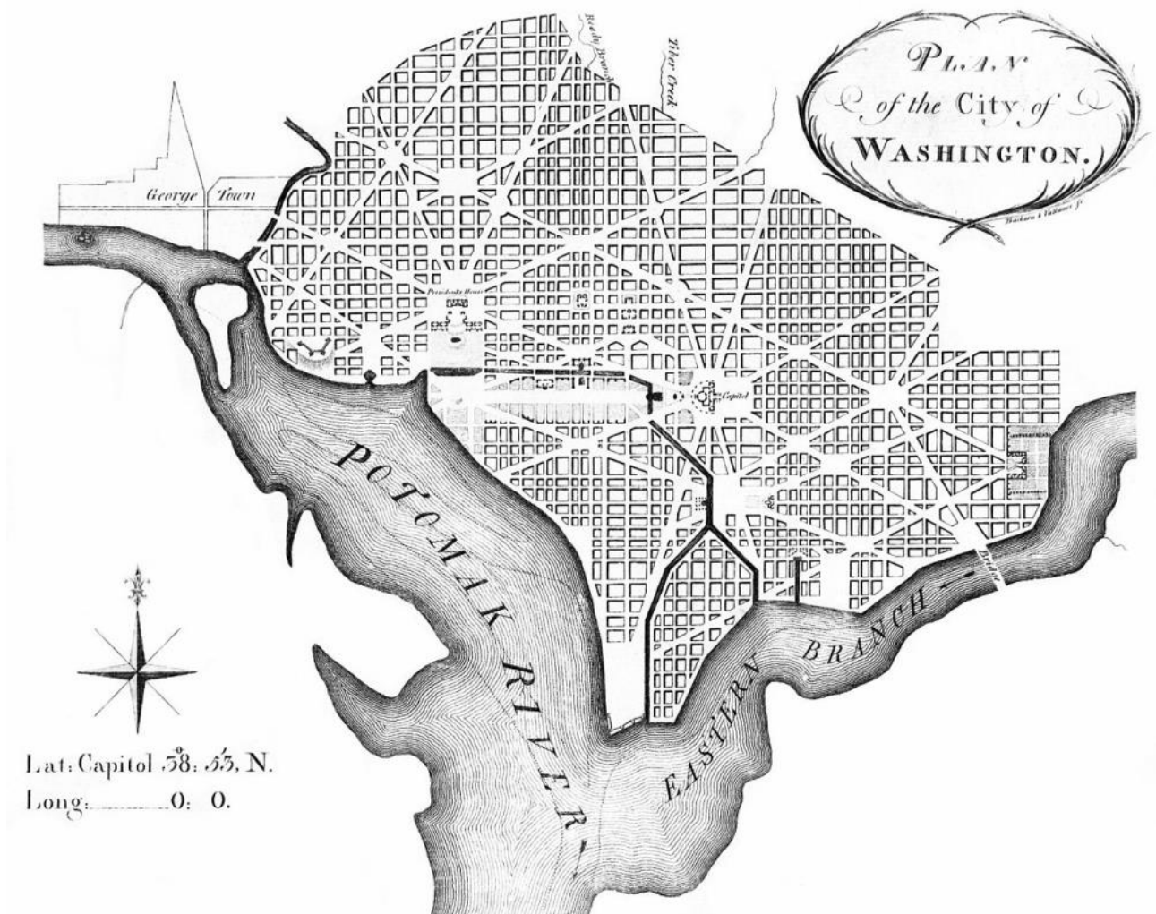
Рис. 1. План м. Вашингтон, 1791р.

Усі дорожні знаки в місті включають в записі скорочення сектора, щоб вказати на місце розташування об'єкта. Переважну більшість вулиць міста перетинають проспекти (авеню). Авеню, як правило, носять назву того чи іншого штату країни. Деякі вашингтонські вулиці особливо примітні, наприклад, Пенсильванія-Авеню, що поєднує Білий дім з Капітолієм, а на Массачусетс-авеню розташовані 59 посольств, через це вулицю іноді жартівливо називають «Посольський ряд».