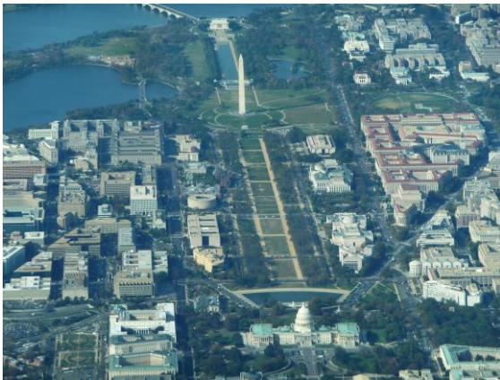
Рис. 4. Національна алея. Вид з пташиного лету