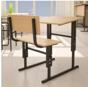
Рис. 1. Регульовані шкільні меблі

твом викладачів. За кожним школярем закріплюється відповідна рослина, за якою він доглядає. Це добре впливає на здоров'я