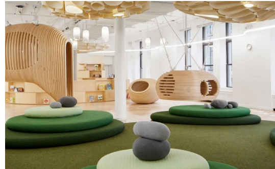
Рис. 2. Тиха зона

та емоційне заспокоєння дітей, а також виховує дбайливе ставлення до природи ще малечку.