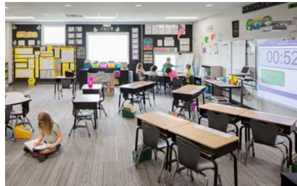
Рис. 6. Інтер'єр класу з модульними партами