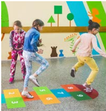
Рис. 5. Елемент ігрової кімнати у школі

та емоційне заспокоєння дітей, а також виховує дбайливе ставлення до природи ще малечку.