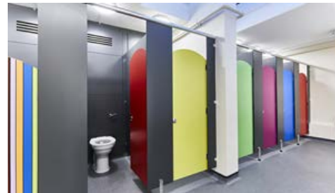
Рис. 4. Дверцята, що є акцентом приміщення