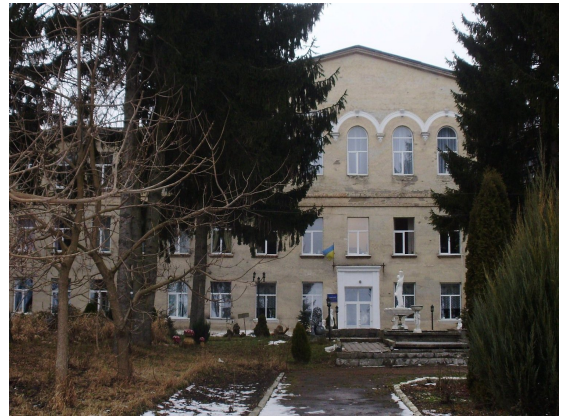
Рис. 8. фасад офіщини фото 2015 р.

Найбільш значним садовим павільйоном був "темпліум", що одержав свій закінчений вигляд вже по смерті старостіни Людвіки. Збудований виразно в романтичному стилі. Темпліум в перекладі з французької " templum " - замок. Знаходиться в невеликій котловині на південь від палацу і флігеля - офіщини. Найбільш віддалена частина парку, що лежала в північно-західній частині комплексу [4].