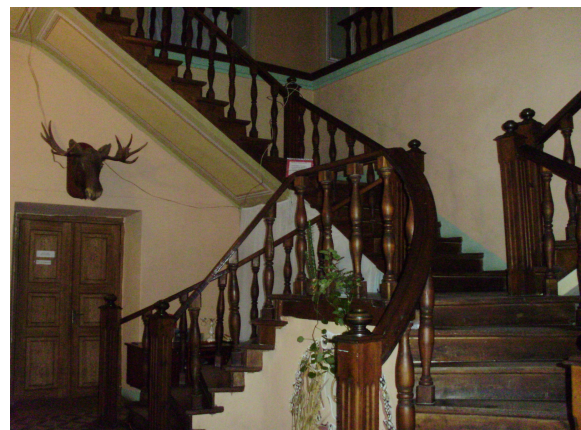
Рис. 6. Інтер'єр палацу садиби графа Ходкевича