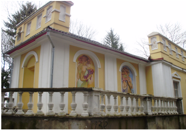
Рис. 7. Садовий павільйон, темлюм

підкови. Над широким каналом, паралельно, до осі резиденції, по лівій північній стороні розбито алеї, що вели до ріки і замикались далеким пейзажем. По другому боці каналу закладено фруктовий сад з павільйоном фігових дерев [6].