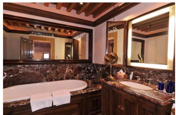
Рис. 5. Апартаменти класу люкс Chateau de Bagnols а) апартаменти класу люкс б) ванна кімната в апартаментах