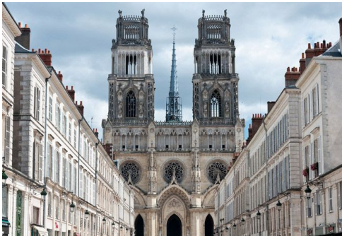
Рис. 2. Фасад замку Sainte-Croix, м. Орлеан

Собор Sainte-Croix (Св. Хреста), м. Орлеан, належить до культурної спадщини та використовується під історичний музей (рис. 2-3).