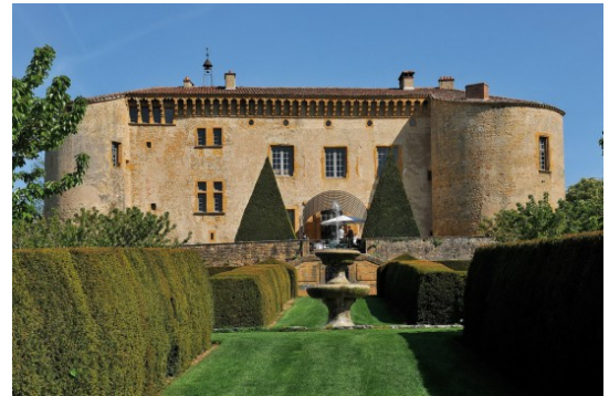
Рис.4. готель-замок Chateau de Bagnols , регіон Божоле а) фасад замку Chateau de Bagnols б) сад при замку Chateau de Bagnols

Сьогодні замок є не тільки найбільшим історичним пам'ятником Франції, а й унікальним готелем класу люкс. В його стінах розміщений 21 номер і апартамент для гостей (рис. 5).. Кожен з них декорований за спеціальним проектом за допомогою тканин, старовинних меблів, гобеленів і фресок, що датуються 15-м століттям. На території готелю працює ресторан "Salle des Gardes", відзначений зіркою знаменитого французького путівника "Michelin".