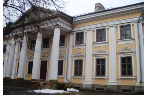
Рис. 1. Зовнішній вид садиби