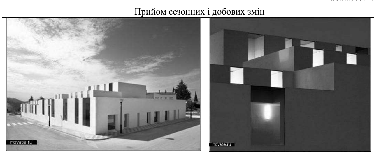
Таблиця № 7

Висновки. Підводячи підсумки, можна зазначити, що архітектурне середовище будівель ДДЗ знаходиться в нерозривному залежності від змін, що відбуваються в різних сферах діяльності суспільства (соціальної, наукової, економічної і т.д.). Процес оновлення та вдосконалення системи дошкільної освіти, а також соціальні та науково-технічні зміни тягнуть за собою швидке моральне і функціональне старіння будівель з жорсткою планувальною