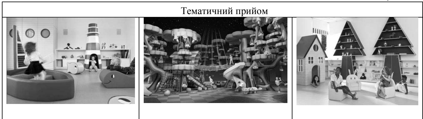
Таблиця № 6

Прийом сезонних і добових змін реалізується шляхом використання в інтер'єрі гри світла і тіні за рахунок використання різних оздоблювальних матеріалів (матових, прозорих і напівпрозорих) і пластики фасадів будівлі ДДЗ. Цей прийом дозволяє значно збагатити інтер'єр та екстер'єр садочка впродовж світлового дня і змінити вигляд відповідно до сезону (табл. 7).