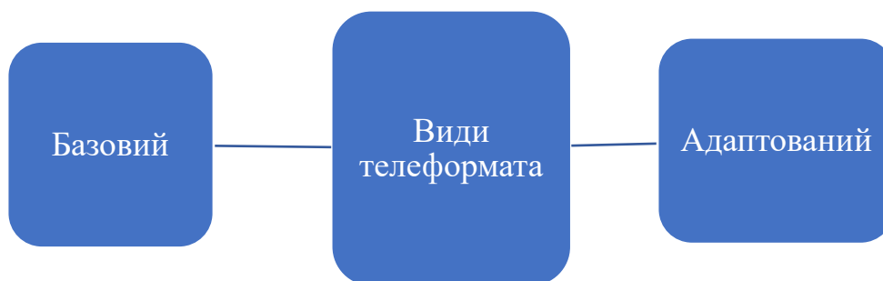
Рис. 1.3. Види телеформату

Щоб створити справді якісний телеформат, сценаристи повинні докласти неабияких зусиль. Можна порівняти телеформат з кінофільмом, адже, як і останній, телеформат повинен бути детально прописаним. Згодом, коли зазначать усі важливі складові елементи, конкретні події та повну, так звану, «Біблію формату», він стане складним об'єктом аудіовізуального виробництва. З вищезазначеного про складові елементи, які визначають майбутню концепцію твору, випливає необхідність окреслити види телеформату (див. рис. 1.3).