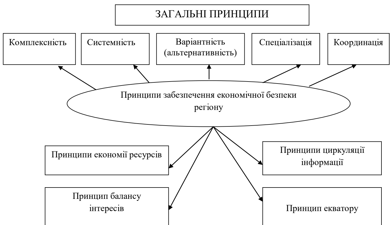
Рис.1.1. Принципи забезпечення економічної безпеки регіону

– варіантність (альтернативність), або виявлення та обґрунтування декількох варіантів економічної безпеки, з одного боку, обчислення траєкторії соціально-економічного розвитку - з іншого, мінливість інвестицій, взаємодія з партнерами у мінливих ринкових умовах та виклики економічних, соціальних та політичні суб'єкти дозволяють, використовуючи ефект «перекриття» індивідуалізованих, інноваційних, ризикованих дій та їх складової, постійно знаходитись у просторі загальної сприятливої ринкової кон'юнктури, забезпечуючи тим самим прискорений оборот капіталу, трудових ресурсів, над привабливий прибуток та високий потенціал економічної безпеки;