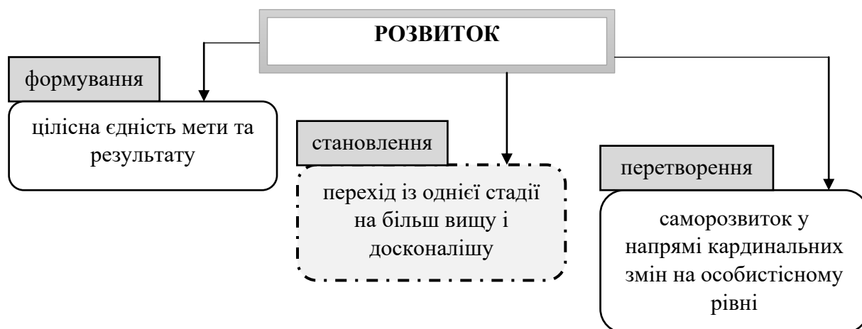
Рис.1. Педагогічна проекція структурованості феномена «розвиток»

Феномен професійно-педагогічне становлення є досить значущим для педагогічної науки, оскільки є складовим компонентом розвитку (див. рис. 1).