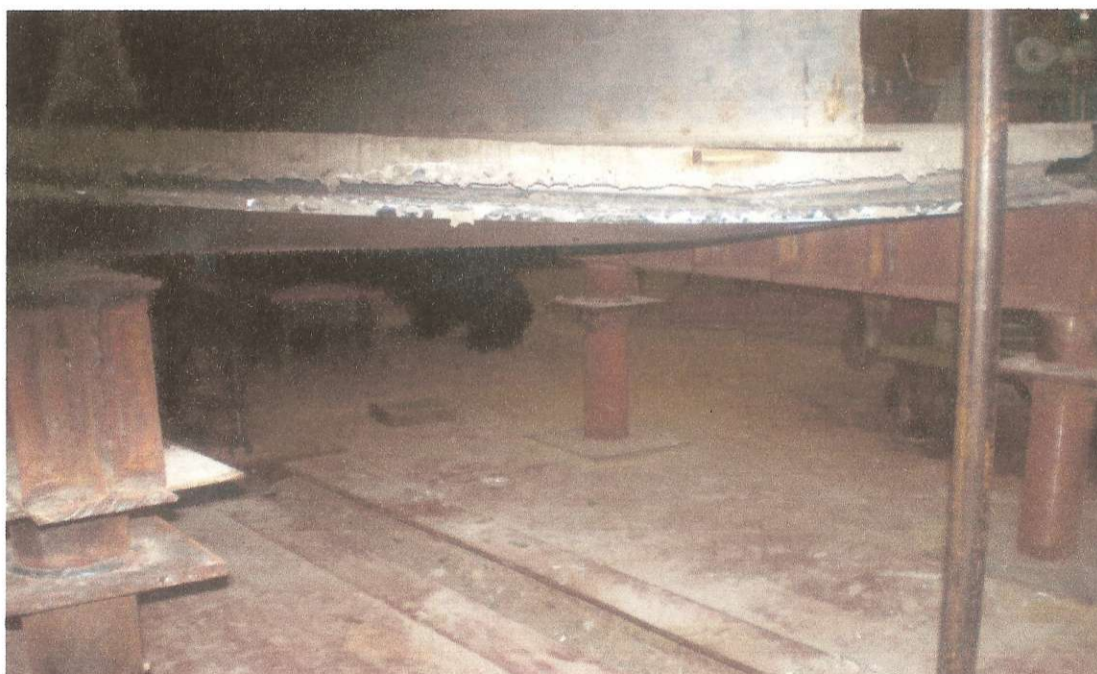
Рисунок 4 – Характер деформування та руйнування конструкції дослідного зразка при наявності склеювання