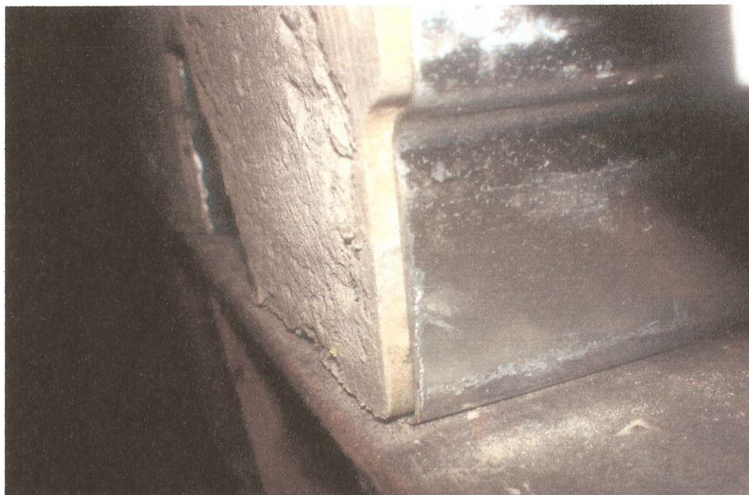
Рисунок 3 – Зміщення бетонного блоку відносно профнастилу

Про відшарування бетонного блоку від профільної сталі в граничному стані при відсутності склеювання можна судити з рисунку 3. При наявності склеювання профнастил і бетонний блок працювали сумісно аж до втрати несучої здатності зразків (рисунки 4).