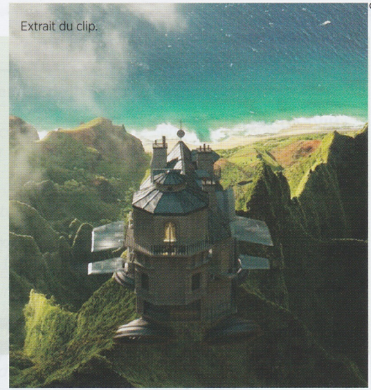
Extrait du clip.

Emmène-moi Emmène-moi Loin de cette ville que je connais par cœur Voir les pyramides saluer les pharaons Emmène-moi Et tu seras En plein hiver dans le port de Honfleur Mon refuge où que nous allions Et tu seras Emmène-moi Mon refuge où que nous allions Embrasse-moi à l'ombre des pommiers Emmène-moi Ce sera dimanche tous les jours de l'année Voir le Japon, ses cerisiers en fleurs Et tu seras Emmène-moi Mon refuge où que nous allions Écouter les sirènes envoûter les pêcheurs Faut dire qu'avant toi Et tu seras Jamais je n'ai eu de maison Mon refuge où que nous allions Oui, et tu seras Emmène-moi Mon refuge où que nous allions Embrasse-moi à l'ombre des pommiers Allez, emmène-moi Ce sera dimanche tous les jours de l'année Emmène-moi Emmène-moi Emmène-moi Dans des forêts sombres où nous nous perdrons