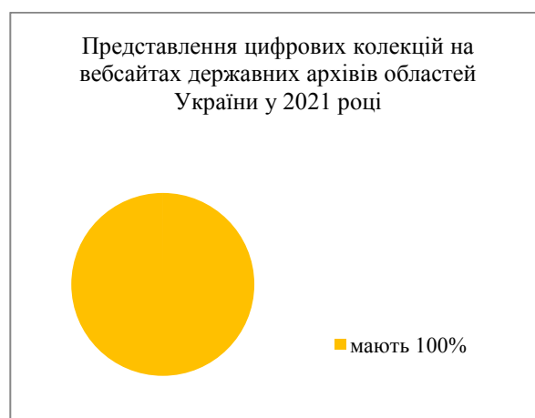
Рис. 3. Показники цифрових колекцій на вебсайтах державних архівів областей України у 2020 році

Аналіз інформаційного наповнення вебсайтів державних архівів областей України цифровим контентом, зокрема й різновидовими колекціями, засвідчив позитивні зміни контекстової поведінки вебсайтів архівних установ щодо відкритості та доступу до наявних інформаційних ресурсів. Віддалений доступ до електронних інформаційних ресурсів сприяє полегшенню роботи споживачам із архівними джерелами, що позитивно впливає на налагодження комунікаційної взаємодії між архівною установою та її відвідувачами. З метою виявлення найбільш інформативних у контексті представлення та популяризації архівних ресурсів за допомогою оцифрованих документів, авторкою дослідження було проведено аналіз вебсайтів 24 державних архівів областей України. Отримані результати дослідження показали, що інформаційні ресурси вебсайтів архівних установ все активніше використовують сучасні інтернет-технології для підвищення ефективності управління та доступу до архівної інформації, її популяризації, розвитку інноваційних форм взаємодії з суспільством. Найбільш інформативними серед проаналізованих є вебсайти державних архівів Вінницької, Київської, Кіровоградської, Миколаївської, Одеської, Сумської та Харківської областей.