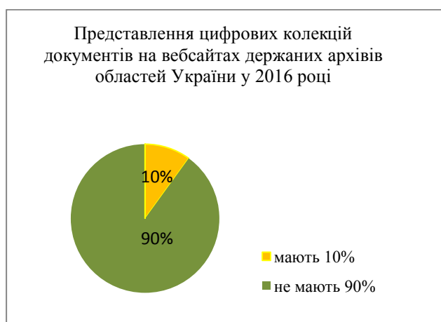
Рис. 2. Показники цифрових колекцій на вебсайтах державних архівів областей України у 2016 році

Проте найбільш суттєві зрушення з оцифрування колекцій архівних документів відбулися в державних архівах областей України, що відобразилося на публікації електронних документальних ресурсів в онлайн-режимі на вебсайтах архівних установ. Якщо моніторинг 2016 р. засвідчив наявність електронних архівів (колекцій унікальних документів, карт, фотодокументів та ін.) на 10 % вебсайтів державних архівів областей України [44] (див. рис. 2), то за результатами контент-аналізу, проведеного у першій половині 2021 року, цей показник становить уже 100 % (див. рис. 3).