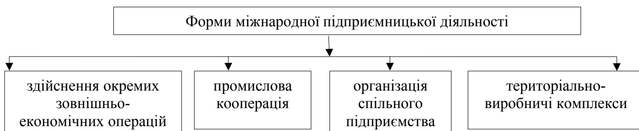
Рис. 2. Форми міжнародної підприємницької діяльності

Форми міжнародної підприємницької діяльності представлені на (рис. 2).