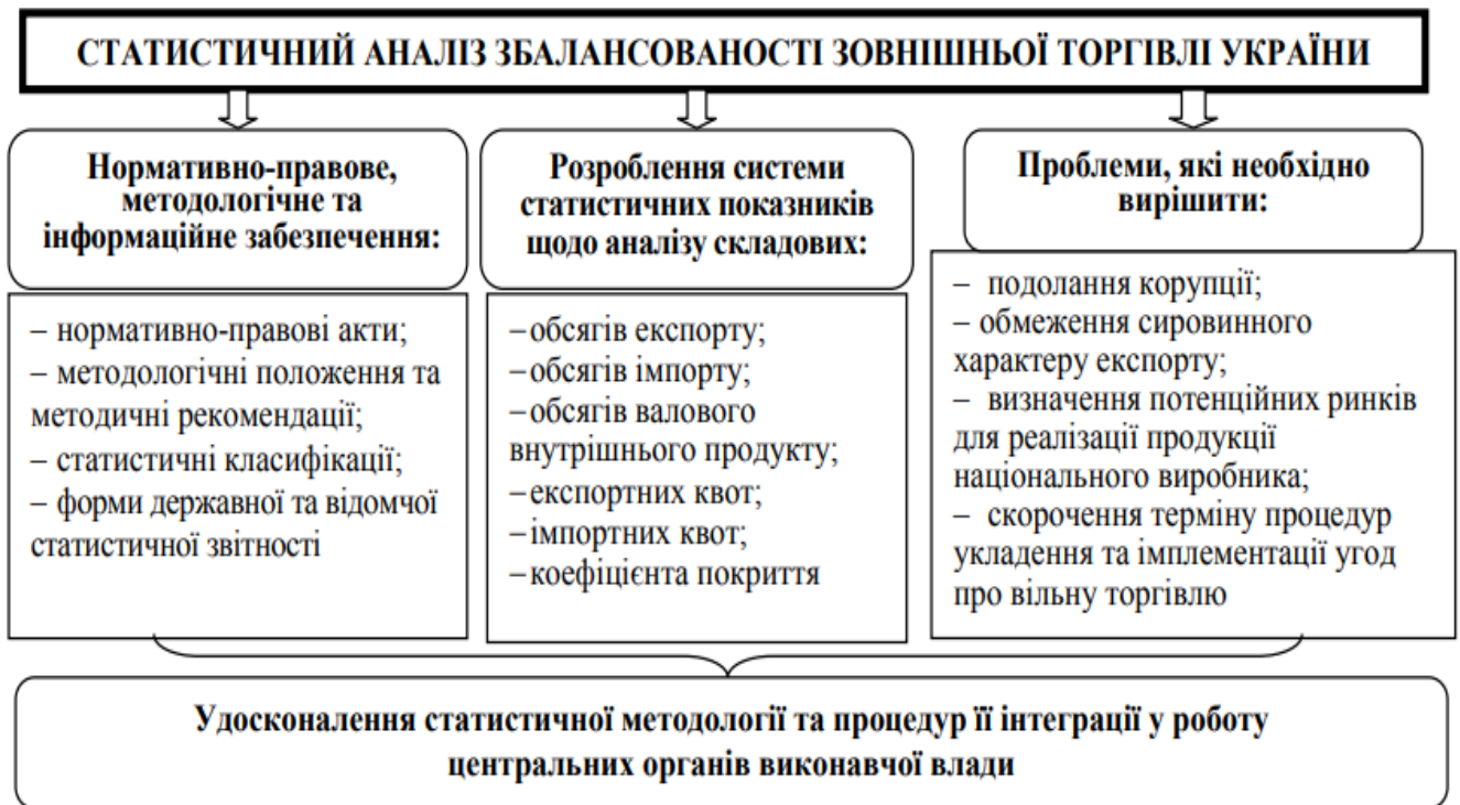
Рис 1.1. Концептуальна схема статистичного аналізу збалансованості зовнішньої торгівлі України

Міжнародна торгівля дає багато переваг, завдяки яким стимулюється економічне зростання. За допомогою торгівлі країни отримують можливість спеціалізуватися у кількох провідних сферах економіки, імпортуючи цей продукт, який самі не мають змоги виробляти. Крім того, торгівля сприяє розповсюдженню нових ідей та технологій (якщо в будь-якій країні з'являється важливе відкриття, міжнародні торговельні зв'язки «розносять» його повсюду світу), (рис 1.1.):