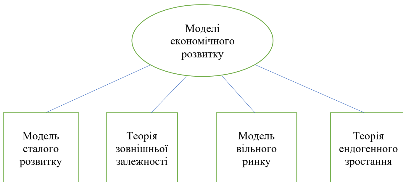
Рис. 1.2. Моделі економічного розвитку

заходи щодо досягнення мети) визначаються конкретними умовами взаємозв'язку та взаємодії економічних факторів.