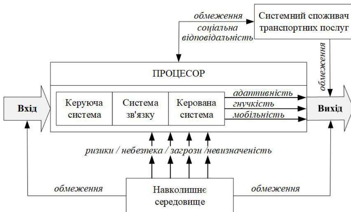
Рисунок 1 – Функціонально-орієнтована декомпозиція транспорту

функціонування природно-технічної системи і визначення стратегічних цілей);