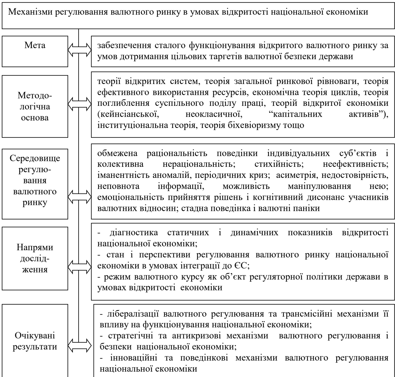
Рис. 1 - Концепція удосконалення механізмів регулювання валютного ринку в умовах відкритості національної економіки

Обґрунтовано концепцію удосконалення механізмів регулювання валютного ринку в умовах відкритості національної економіки в частині мети, методологічної основи, середовища регулювання валютного ринку, напрямів дослідження, очікуваних результатів (рис. 1).