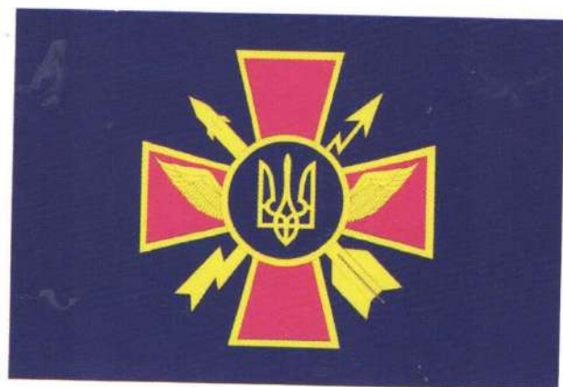
Прапор Військ протиповітряної оборони