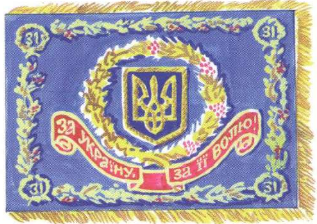
Проект Бойового Прапора частин Сил оборони повітряного простору (СОПП), а також авіачастин ВМС України (аверс)