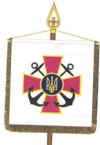
Штандарт командувача Військово-Морських Сил Збройних Сил України