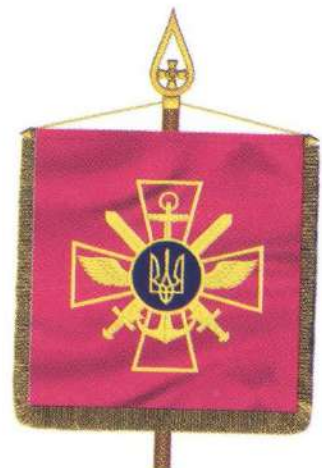
Штандарт начальника Генерального штабу Збройних Сил України