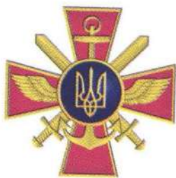
Емблема Генерального штабу Збройних Сил України