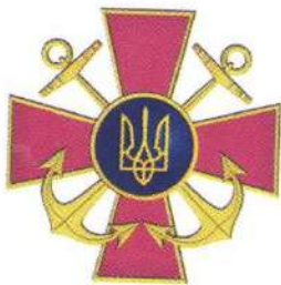
Емблема Військово-Морських Сил Збройних Сил України