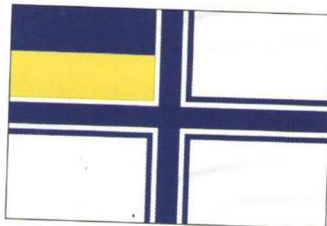
Військово-Морський Прапор Збройних Сил України