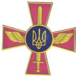
Емблема Повітряних Сил Збройних Сил України