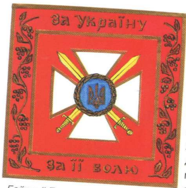
Бойовий Прапор військової частини.