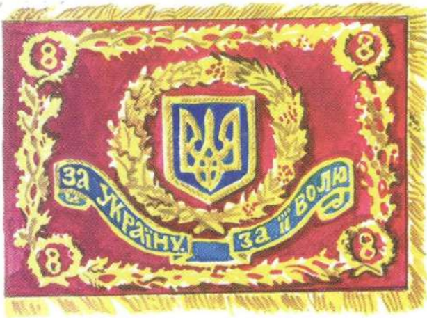
Проект Бойового Прапора частин Сил наземної оборони, а також наземних частин ВМС України (аверс)