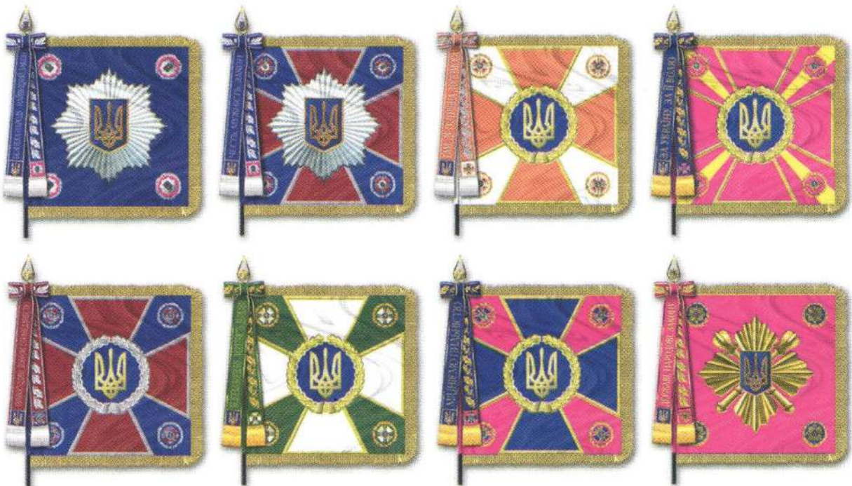
Бойові прапори частин