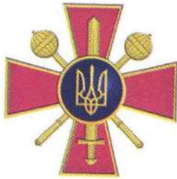
Емблема Міністерства оборони України