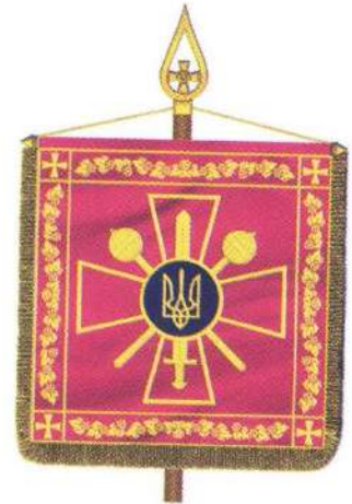
Штандарт Міністра оборони України