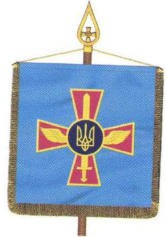
Штандарт командувача Повітряних Сил Збройних Сил України