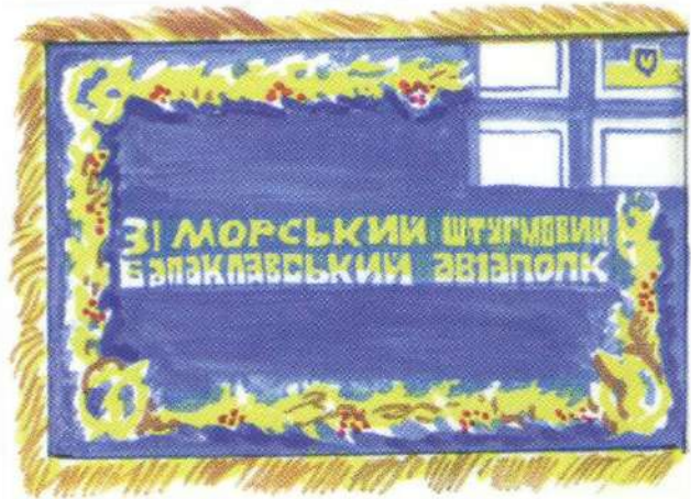
Проект Бойового Прапора авіачастин ВМС України (реверс) Автори О. Руденко і К. Гломозда