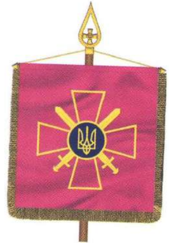
Штандарт командувача Сухопутних військ Збройних Сил України