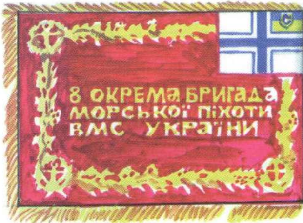
Проект Бойового Прапора наземних частин ВМС України (реверс)