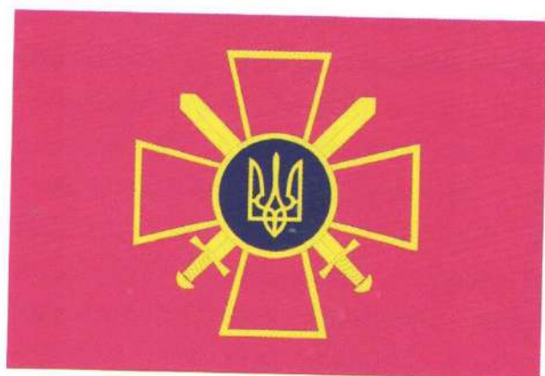
Прапор Сухопутних військ

Тим часом фактична відсутність загального символу негативно позначалася на розвитку української військової символіки, позбавляючи її своєрідного «стрижня». На погляд керівника Воєнно-геральдичної служби полковника Олександра Муравйова, емблема-символ Збройних Сил України має відображати славні традиції національного війська. В основу запропонованого символу покладено хрест малинового кольору з рівними кінцями, що розширюються.