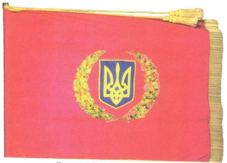
Прапор Сухопутних військ

Бойовий Прапор військової частини в проекті О.Кохана повторював основні риси прапора виду військ, але з деякими доповненнями. Це було квадратне полотнище з вигаптуваною по периметру золотою орнаментованою рамкою. У центрі полотнища (для наземних військ – малинового кольору, для авіації – синього, для екіпажів військових кораблів – білого з темно-синім хрестом) розміщувалася символіка виду військ. У верхній частині – напис «За Україну», а в нижній – «За її волю». На звороті пропонувалося гаптувати напис з назвою військової частини. Краї полотнища мали бути обшиті жовтими торочками. Пізніше, на пропозицію Центрального музею ЗС України, до хрестів додали мечі, і такі прапори пропонувалося вручати частинам бойового складу, а без мечів – частинам забезпечення.