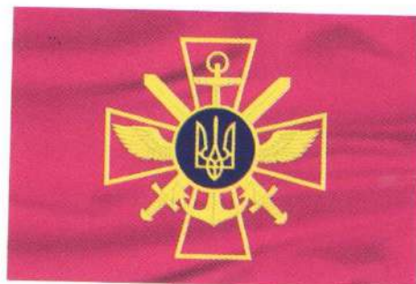
Прапор Генерального штабу Збройних Сил України