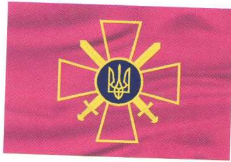
Прапор Сухопутних військ Збройних Сил України