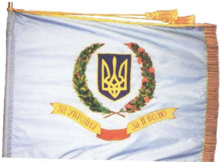
Прапор Військ повітряної оборони