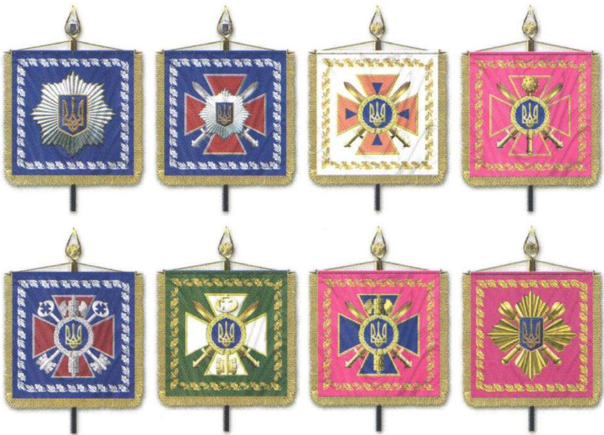
Персональні прапори (штандарти) керівників силових структур України