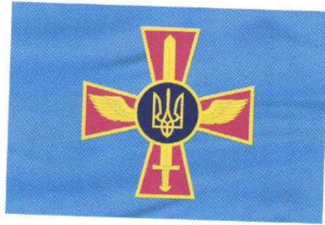
Прапор Повітряних Сил Збройних Сил України