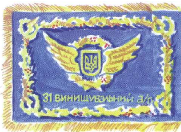
Проект Бойового Прапора частин Сил оборони повітряного простору (СОПП) (реверс)