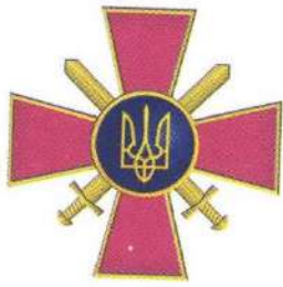
Емблема Сухопутних військ Збройних Сил України