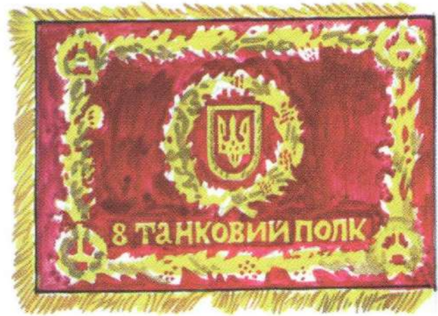
Проект Бойового Прапора частин Сил наземної оборони (реверс)