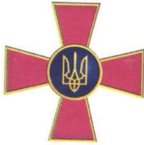
Емблема Збройних Сил України