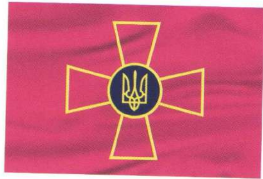
Прапор Збройних Сил України