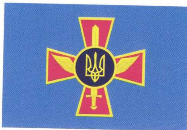
Прапор Військово-Повітряних Сил