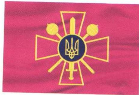
Прапор Міністерства оборони України