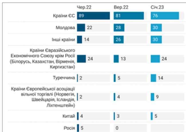
Рис.2. Напрямки експортної діяльності українських підприємств, % експортерів, станом на січень 2023 року

- модернізація та впровадження інновацій: відбудова енергетичної системи на засадах технологій SmartGrid, проектування логістики не лише на військові потреби, а й узгоджено з перспективами євроінтеграції та напрямів розвитку міжнародної торгівлі;