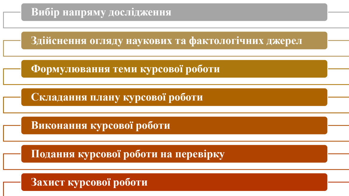
Рис. 1 – Етапи виконання курсової роботи

Виконання курсової роботи здійснюватися шляхом послідовного опрацювання наведених на рис. 1. етапів.