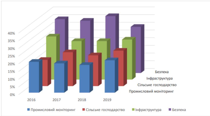
Рис. 1.2. Динаміка розподілу послуг аерозйомки в різних сферах діяльності в Україні за період 2016-2019 роки