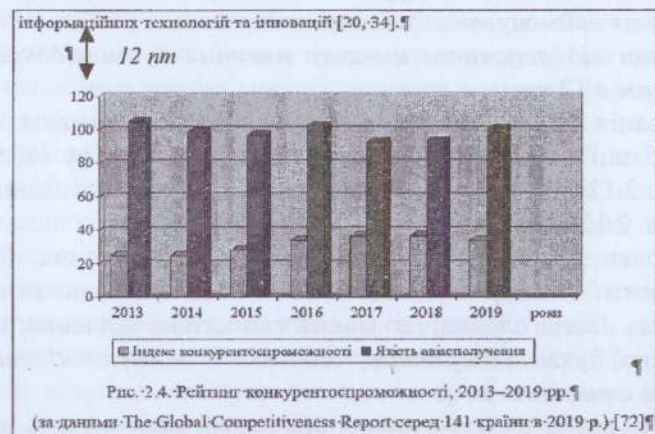
Рис. 2. Приклад оформлення частини тексту із рисунком

Приклад оформлення частини сторінки основного тексту із рисунком наведено на рис. 2.