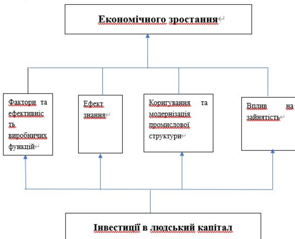
Рис. 2.2. Аналіз механізму впливу людського капіталу на економічне зростання

З наведеного вище аналізу видно, що роль людського капіталу у сприянні економічному зростанню є вирішальною і незамінною. На основі попереднього аналізу автор прочісує та узагальнює механізм людського капіталу на економічне зростання так: країна або 3 точки зору регіонів, її інвестиції в людський капітал можуть здійснюватися через виробничу функцію елементів людського капіталу, виробничу функцію ефективності людського капіталу, ефект людського капіталу «знання», вплив людського капіталу на пристосування та модернізацію промислової структура та вплив людського капіталу на зайнятість робочої сили Сукупний ефект попиту та пропозиції сприятиме економічному зростанню[19].