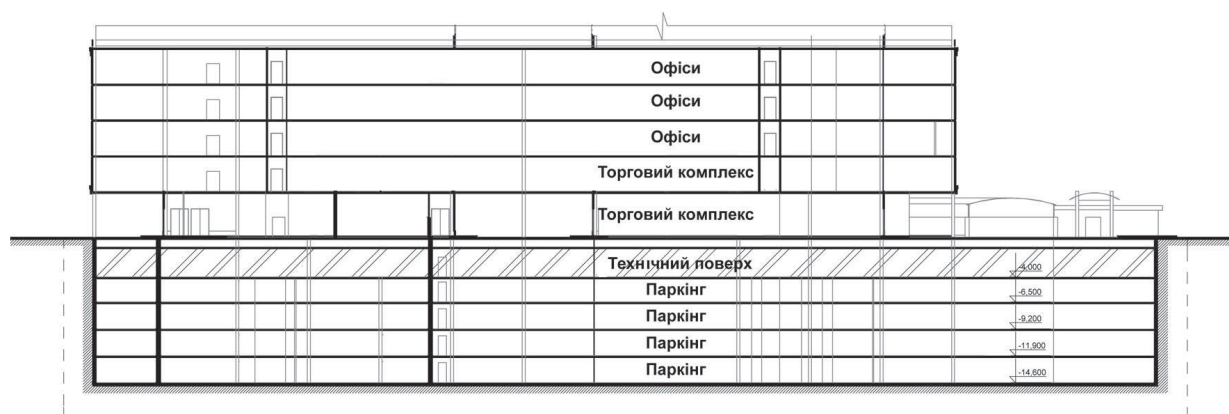
Рисунок 2. Вертикальне рішення