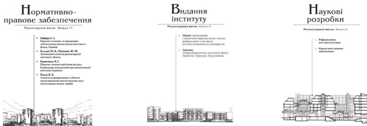
Рисунок 4. Приклади шмуцтитулів окремих розділів

У 2007 р. з метою висвітлення та популяризації результатів наукової, науково-дослідницької, проектної та видавничої діяльності інституту «НДІпроектреконструкція» та його філіалів були запропоновані нові розділи «Наукові розробки», «Видання інституту» (рисунк 4), «Практика сучасного проектування та будівництва» [9] (рисунк 5).