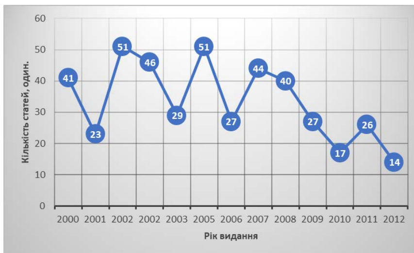
Рисунок 2. Кількісні показники наповнення видання впродовж 2000-2012 років