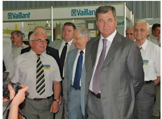
Рисунок 1. Відкриття ІХ Міжнародної виставки-конференції «Реконструкція житла», 5 червня 2007 р., Київ, «Український Дім»

Динаміка розвитку відповідних процесів аналізувалась та висвітлювалась на сторінках видання, формування та підбір матеріалів якого здійснювався за основними тематичними напрямками (таблиця 1).