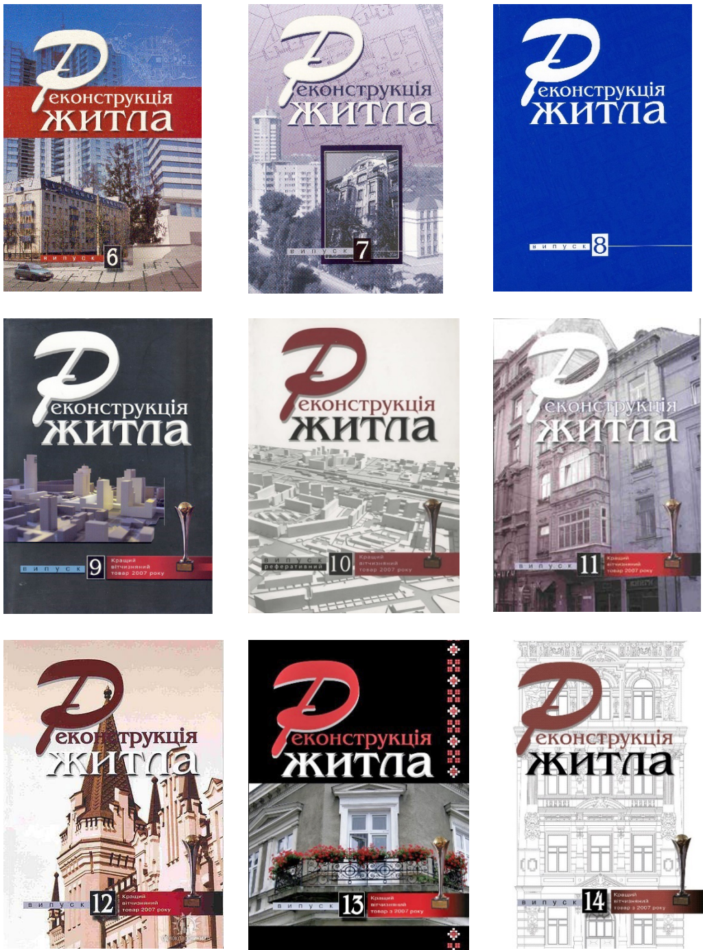
Рисунок 6. Обкладинки науково-виробничого видання, 2005-2012 рр.