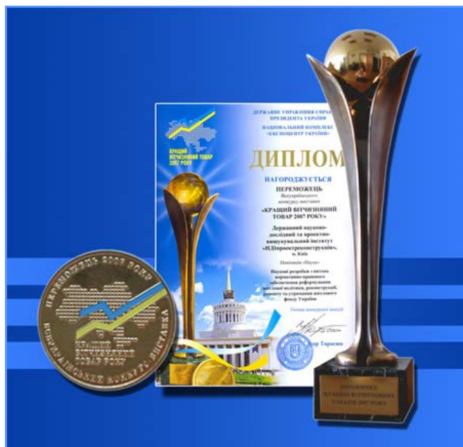
Рисуюнок 7. Нагороди Всеукраїнського конкурсу «Кращий вітчизняний товар 2007 року», номінація «Наука»

До відкриття Х ювілейної виставки-конференції «Реконструкція житла-2008» здійснено випуск двох номерів – дев'ятого та десятого (реферативного). В останньому розміщено реферати всіх статей, які були оприлюднені впродовж 1999 – 2008 років.