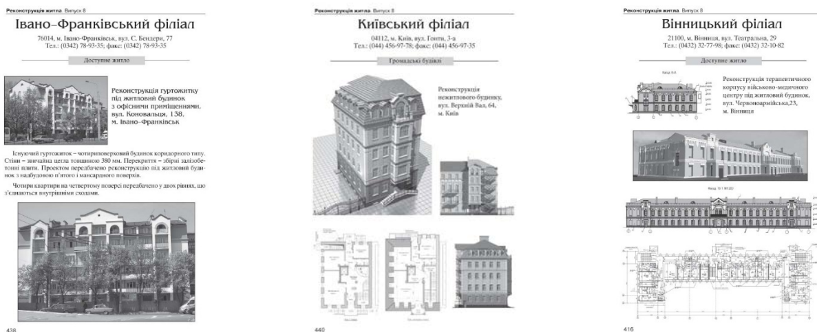
Рисунок 5. Приклади шмуцтитулів розділу «Практика сучасного проектування та будівництва»