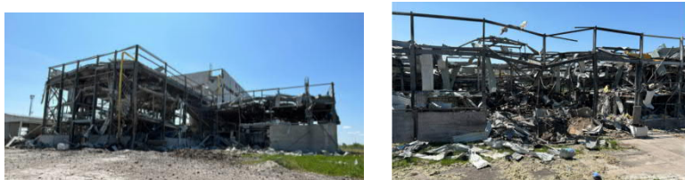
Рис. 2. Наслідки ракетних обстрілів РФ італійсько-українського підприємства «Zeus Ceramica» [2]

Так, наприклад, зі Слов'янська Донецької області були релоковані цехи італійсько-українського підприємства з виробництва плитки та мармуру «Zeus Ceramica», що дозволило зберегти частину виробничих потужностей підприємства, в той час, коли виробничі потужності, які не було можливо вивезти було зруйновано обстрілами окупантів (рис.2.).