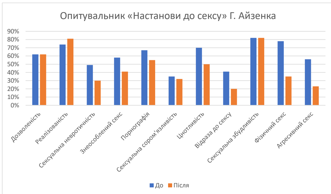
Рисунок 3.2.1. Порівняння результатів методики опитувальника «Настанови до сексу» до та після проведення психокорекційної програми

Порівняння результатів методики опитувальника «Настанови до сексу» до та після проведення психокорекційної програми зображені на рисунку 3.2.1.